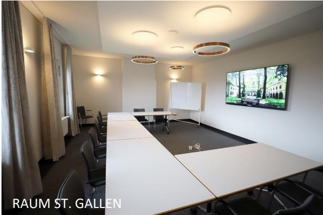
RAUM ST. GALLEN